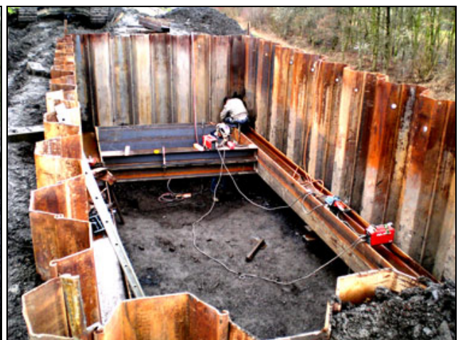
Bild3: Erstellung der 11 Meter tiefen Baugruben

Die neue Rohrleitung konnte wegen der extremen Lagetiefe von bis zu 11 Metern unter der Geländeoberkante in der geschlossenen Bauweise wesentlich wirtschaftlicher eingebaut werden. Ein besonderes Augenmerk fiel auf die Anwendbarkeit des Berstlining- Verfahrens, um eine gleichzeitige Vergrößerung der teilweise im Querschnitt bis zu 100 mm kleineren Drainageleitung zu ermöglichen.