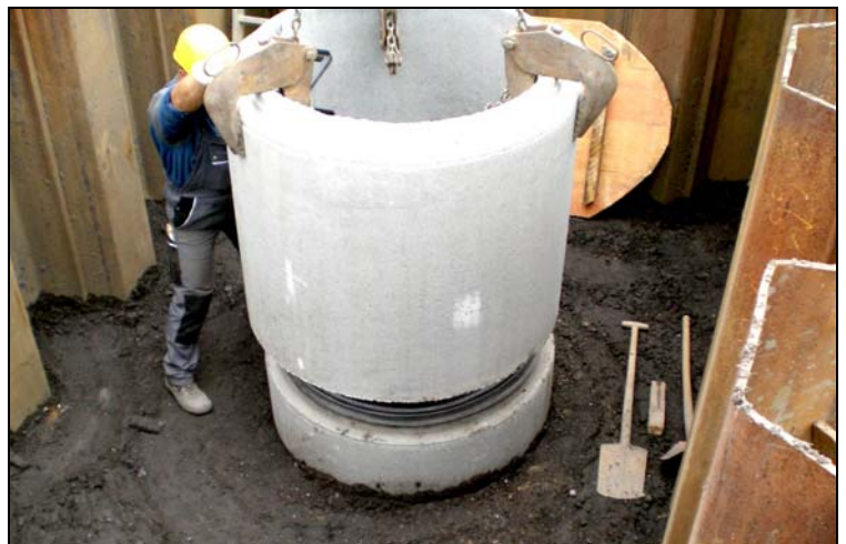
Bild5: Neuerstellung der Schachtbauwerke

In diesem Fall wurden die 11 Meter langen Spundwände für die Gruben durch die Firma FST Spezialtiefbau Finsterwalde eingerüttelt und mit doppelter Gurtung aus zwei übereinander verschweißten Stahlträgern gesichert. Eine andere, zuvor beauftragte Tiefbaufirma konnte den besonders schwierigen Verhältnissen sowohl technisch nicht gerecht werden und meldete noch während der Baumaßnahme auch wirtschaftliche Insolvenz an. Die Firma KURT Kanal- und Rohrtechnik GmbH, die nun den Zuschlag für die Weiterführung der gesamten Baumaßnahme erhielt, musste einen Großteil der bereits angelegten Gruben in Kooperation mit der FST Finsterwalde komplett neu erstellen. (Bild3)