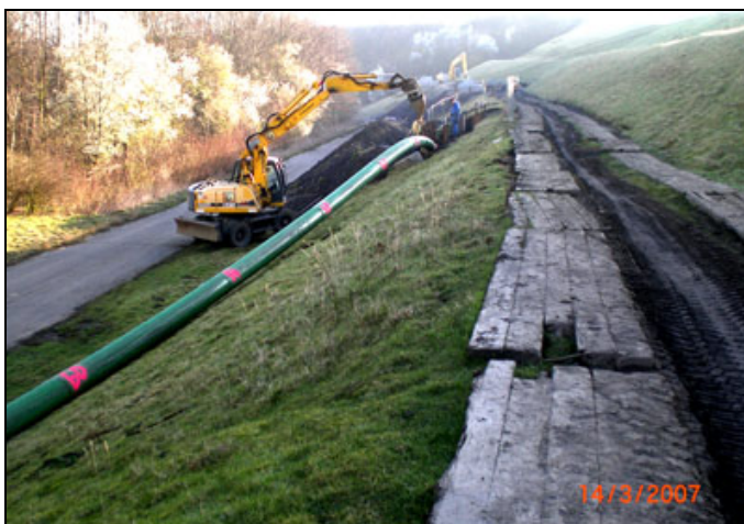
Bild2: Einbau eines Langrohrstrangs

Einsatzbereich waren die Deiche zwischen Lippe, dem Lippe-Altarm und dem parallel zur Lippe liegenden Lippekanal. Diese wurden zum Schutz vor dem wiederholt auftretenden Hochwasser und der Kanal zur damaligen Erschließung des Kohletagebaus angelegt. Zusätzlich zum Hochwasserschutz gehört ebenfalls eine gut funktionierende und ausreichende Deichentwässerung. Die dazu noch vor dem zweiten Weltkrieg eingebaute Drainageleitung aus Porosit, einem porösen, wasserdurchlässigen Betonrohrmaterial für Drainagezwecke in einem Durchmesser zwischen 200 und 400 mm, wies stellenweise Einbrüche aber auch starke Inkrustationen und Auswaschungen auf und sollte durch ein modernes Rohrleitungsmaterial möglichst zeitnah ausgewechselt werden, um ein weiteres Einstürzen des maroden Altkanals zu verhindern. Die Entscheidung fiel auf Kunststoffrohre aus Polyethylen und Polypropylen, die eine sehr hohe Lebensdauer und baustellengerechte Verarbeitungsmöglichkeiten bieten. Die von den Herstellern standardgemäß als Stangenware angebotenen Rohre wurden werkseitig mit den für die Drainagefunktion notwendigen Bohrungen versehen und sollten je nach Haltungsbedingungen einerseits als zwei Meter lange Kurzrohrmodule, andererseits als bauseitig verschweißte Langrohrstränge eingebaut werden. (Bild2)