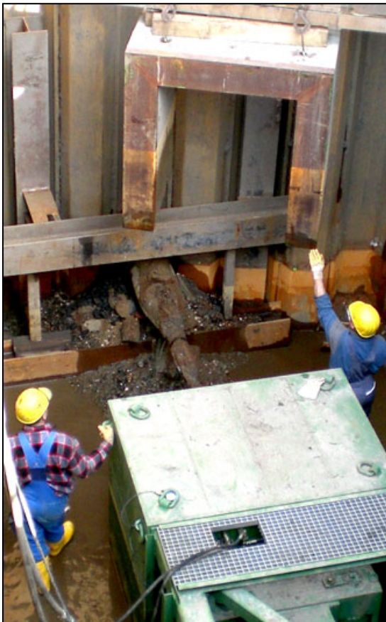
Bild4: Die Bersthülse erreicht die Maschinengrube

Durch den Einsatz verschiedener Techniken der Berstlining- Prozeduren (Kurz- und Langrohrberstlining) konnten hier Einsparungen bei der Herstellung der Maschinenruben, der Widerlager und bei der Schachtwiederherstellung bewerkstelligt werden. Denn gerade in hohen Lagetiefen und im Böschungsbereich der stark durchwässerten Deiche müssen hohe Aufwendungen für den sicheren Verbau der Gruben erbracht werden.